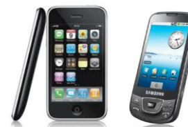
L'innovativo controllo accessi con iPhone e Android