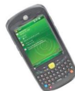
Palmare controllo accessi