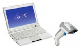
Pc con pistola per controllo accessi